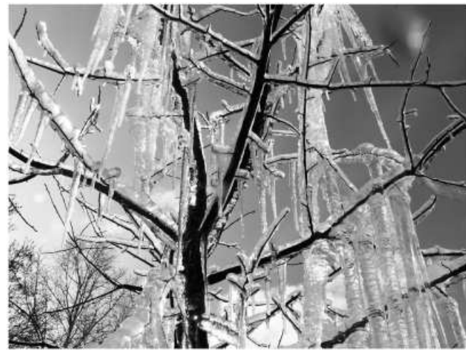
В ЦАРСТВЕ СНЕЖНОЙ КОРОЛЕВЫ