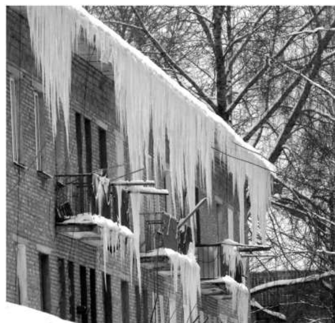
ЛЕДЯНЫЕ ЗАНАВЕСКИ.