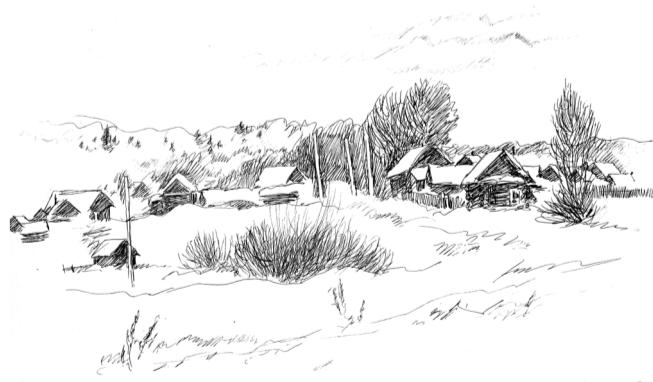
Стоит среди лесов деревенька...